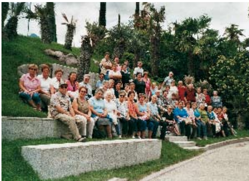
■ In gita ai giardini Trauttmansdorf a Merano.

Il 10 agosto l'appuntamento più atteso, una lunga e piacevolissima giornata: percorrendo la Val di Non, con le Maddalene dora-